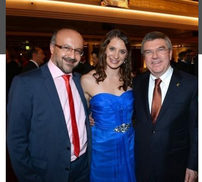
Dr. Thomas Bach